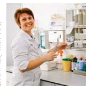
Abbildung: PAUL HARTMANN AG