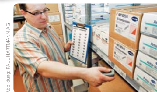
Abbildung: PAUL HARTMANN AG